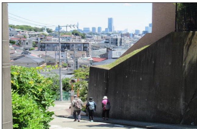
〈『港南区の古道を弘明寺まで』 2023.5.24〉 急坂で有名な餅井坂、下りでよかった