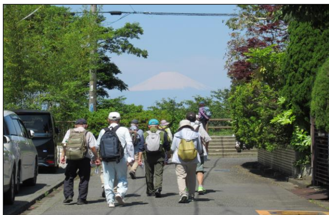
〈『池子の森を抜けて』(緑道⑭) 2023.5.16〉 富士山が大きく、近くに見える「錯覚の富士」