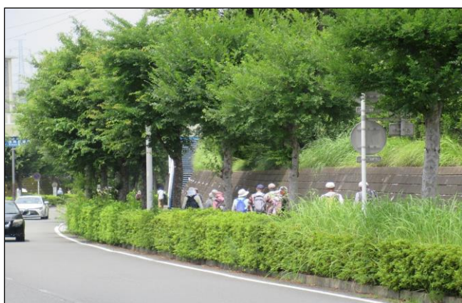
〈『いちょう坂からマロニエ通りへ』 2023.6.24〉 マロニエ通りをゴールの港南台駅に向かう皆さん