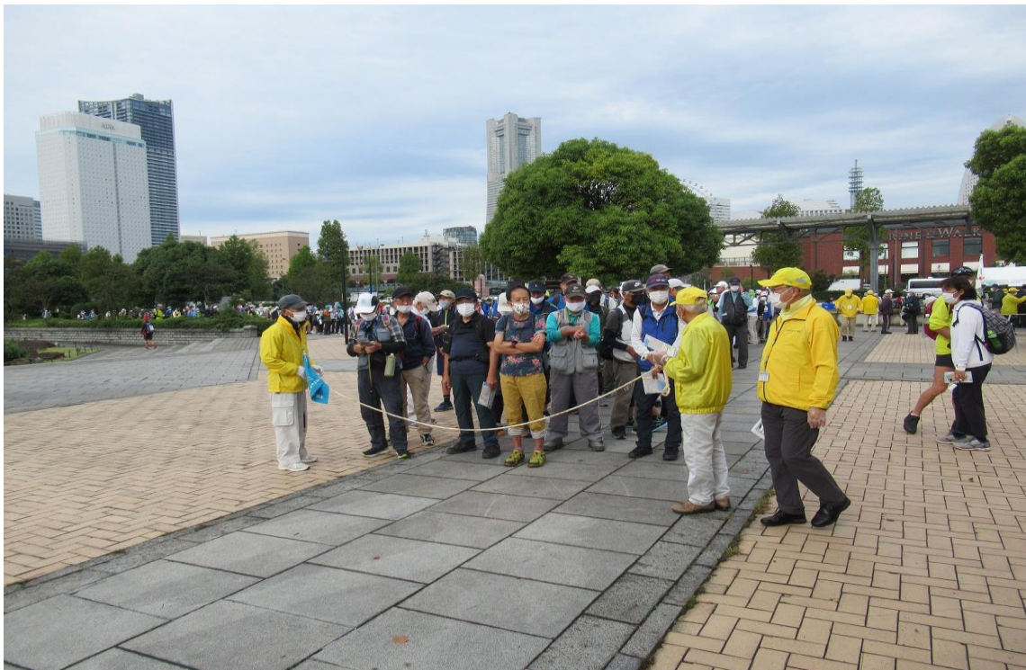
＜ 昨年の第24回港よこはまツアーデーマーチ1日目25kmのスタート風景 ＞

YWA ホームページアドレス URL http://kanagawaken-wa.sakura.ne.jp/ywaindex.html