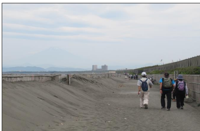
〈『水温む湘南海岸を歩こう』 2023.6.6〉 かすかに富士山も見える中、湘南海岸の遊歩道を歩く