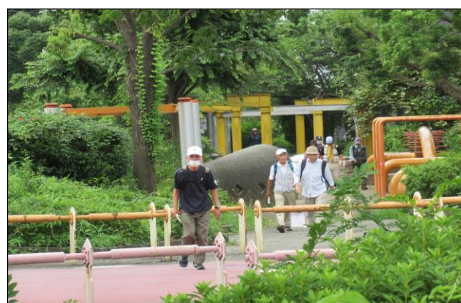
〈『新横浜から緑道を楽しむ』(緑道⑮)2023.7.5〉 「機械の広場」等ユニークなモニュメントのある新田緑道