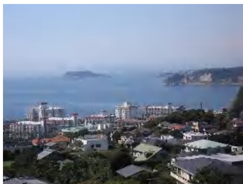
大崎公園から相模湾を望む

JR鎌倉駅 本覚寺 来迎寺 光明寺 材木座海岸 逗子マリーナ 小坪 大崎公園 浪子不動 逗子海岸 渚橋 逗子市役所 JR逗子駅 & 京急逗子駅