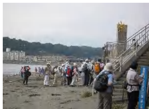
逗子海岸「太陽の季節モニュメント」